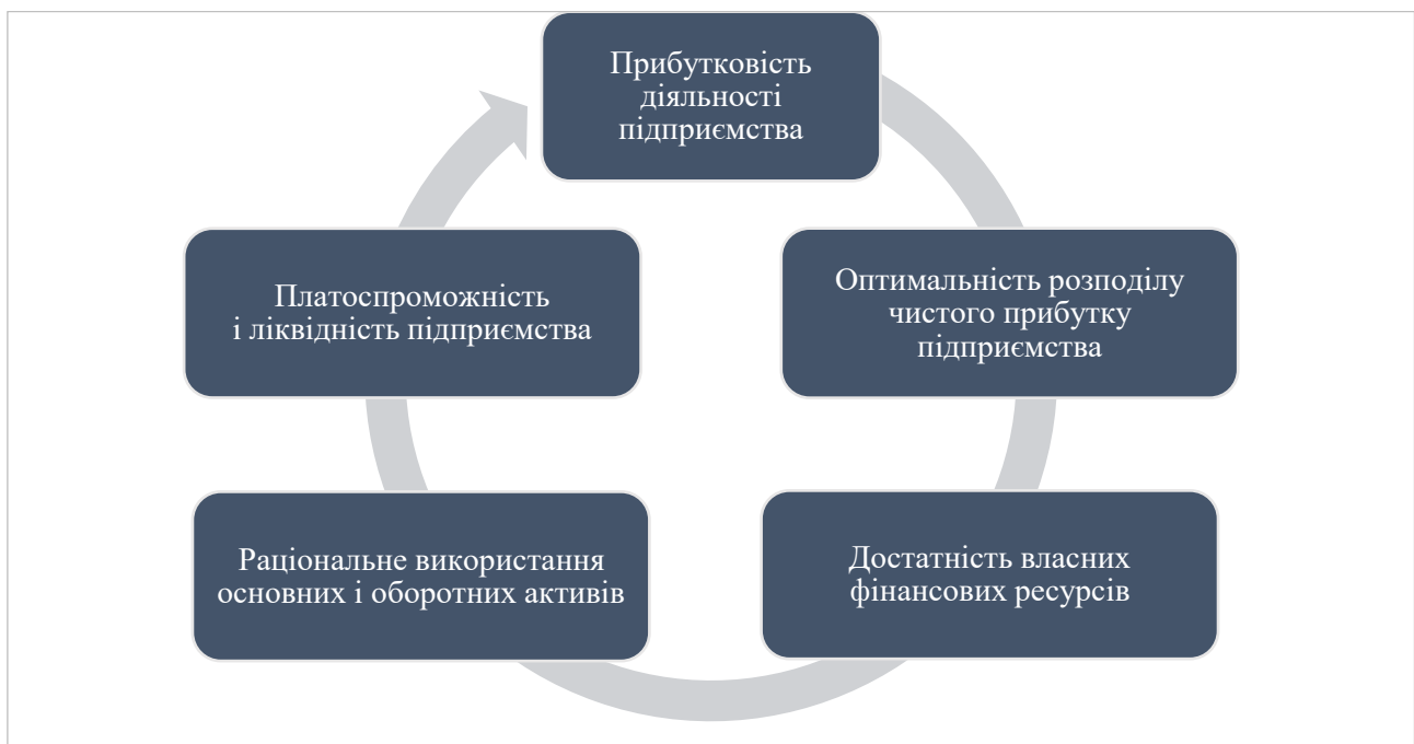
Рисунок 1 – Основні напрями забезпечення ефективності фінансової діяльності підприємства [1]

нансову безпеку (рис. 1). У воєнний період зростає роль зовнішнього фінансування: за даними Національного банку України за програмою «5–7–9 %» [3], від початку її дії (лютий 2020 р.) підприємці отримали 134,5 тис. кредитів на суму майже 460 млрд грн. З них у період воєнного стану – 99,7 тис. кредитів на 370,4 млрд грн. До десятки лідерів за кількістю взятих кредитів увійшли чотири регіони, що належать до зон високого воєнного ризику: Дніпропетровська, Одеська, Київська, Харківська області. Найбільші обсяги кредитування залучені підприємствами в аграрному секторі, переробній промисловості, гуртовій та роздрібній торгівлі.