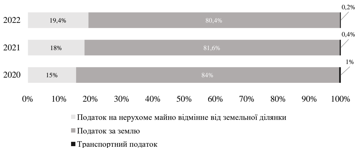
Рисунок 1 – Динаміка структури майнових податків за 2020–2022 рр. [2]

Один із найбільш важливих недоліків механізму майнового оподаткування в Україні – недостатня ефективність системи збору майнового податку. За даними Міністерства фінансів України, у 2021 році було зібрано лише 63 % від запланованого обсягу збору майнового податку [3]. Це свідчить про недостатню ефективність механізму збору майнового податку та потребує серйозних зусиль для його поліпшення.